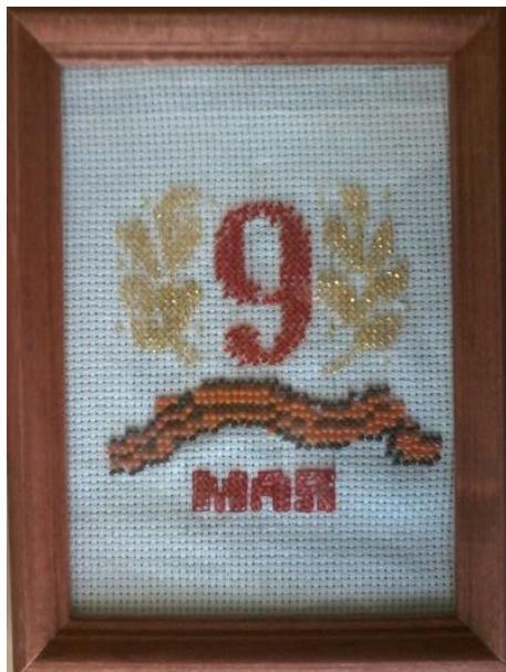
«С праздником!» Хатыпова Рузиля 8 класс