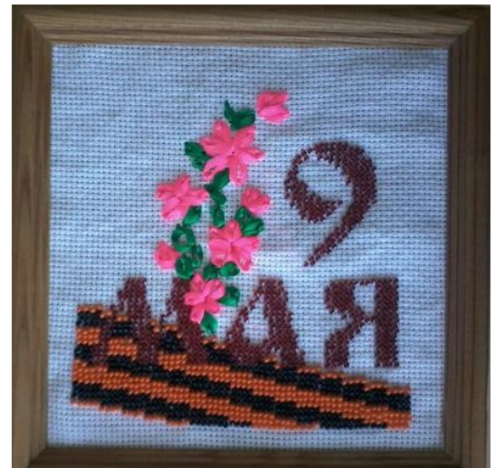
«С 9 Мая!» Зарибзянова Римма 8 класс